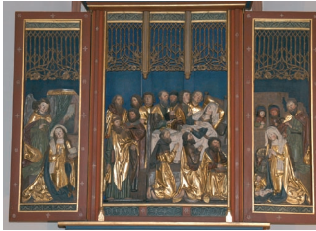
(7) Marienaltar (1517, v. Niklaus Weckmann u. Hans Schäufelein)

aus der Ulmer Werkstatt Niklaus Weckmanns d. Ä., datiert auf der Rückseite mit der Jahreszahl 1517. Künstlerischer Höhepunkt ist das Predella-Relief der Wurzel Jesse. Es ist als Stammbaum Jesu gestaltet. Der liegende Jesse (Isai) ist Vater des Königs David, aus dessen Familie schließlich Josef stammt, der Bräutigam Marias, die den Sohn Gottes zur Welt bringt. Die Darstellung interpretiert das Geschehen von Weihnachten: Gott wird Mensch und reiht sich in eine Generationenfolge ein, so wie jeder Mensch eine Familiengeschichte besitzt. Die Reliefs über der Predella zeigen Ausschnitte aus dem Marienleben: die Verkündigung des Engels Gabriel (links), die Geburt Jesu (rechts) und den Tod Marias (Mitte) im Kreis der Apostel. Während der Advents- und Fastenzeit sind die Flügel des Altars geschlossen, dann sind die vier Tafelbilder zu sehen (von links nach rechts): Joachim trifft Anna an der Goldenen Pforte, Tempelgang der dreijährigen Maria in Begleitung ihrer Eltern, Joachim bei seiner Herde empfängt eine himmlische Botschaft, Zurückweisung des Opfers des Joachim. Sie werden Hans Schäufelein († 1538/40 in Nördlingen) zugeschrieben.