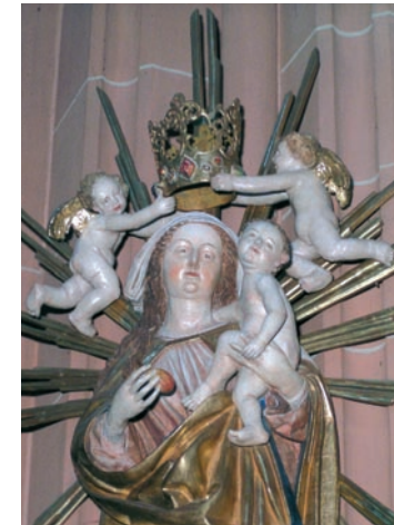
(6) Madonna (1480, v. H. Multscher)