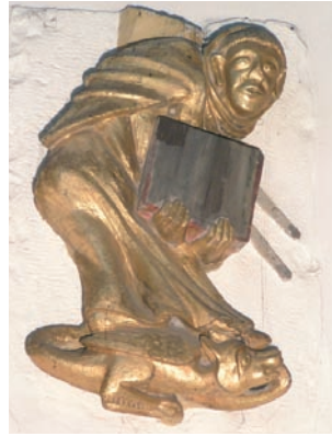
(8) Basiliskenreter (um 1425)

Fastentuch: 18. Jh., 16 Szenen zur Passion Jesu, zu Ostern und Pfingsten (19)