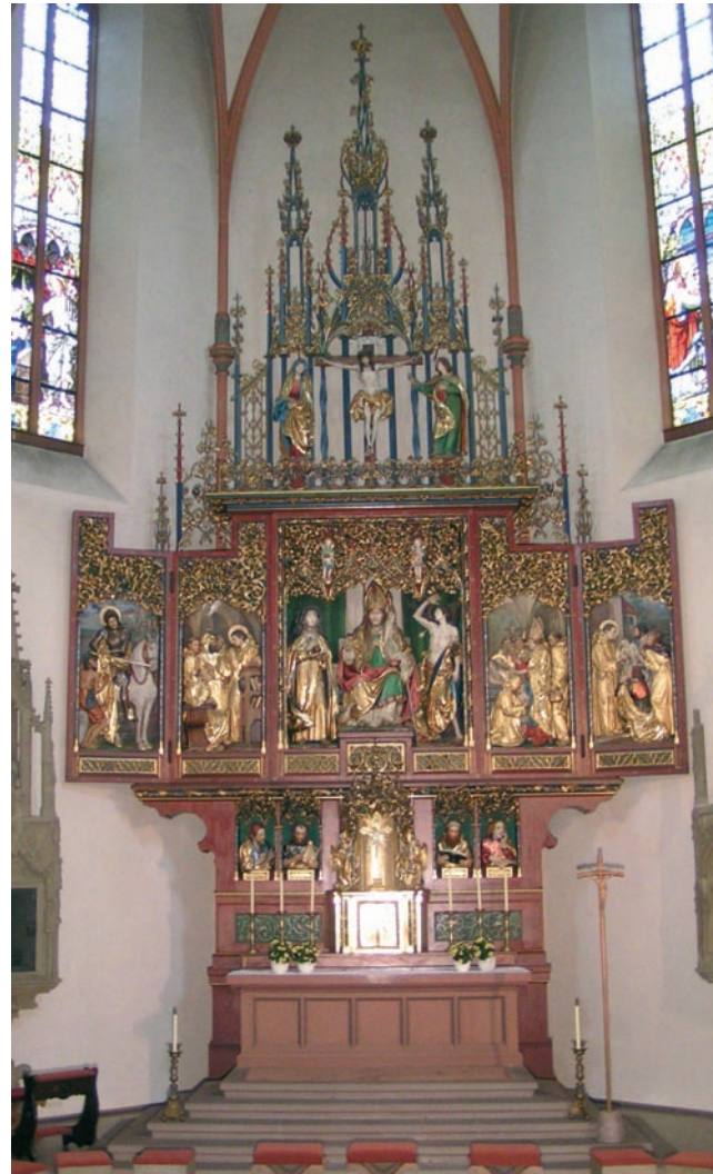
(4) Hochaltar (1915/16, v. Thomas Buscher)

und Seitenschiff laden dazu ein, den Raum zügig zu durchschreiten. St. Martin ist als Weg-Kirche geplant, die uns daran erinnert, dass wir uns in der Gemeinschaft des Volkes Gottes auf einem irdischen Pilgerweg befinden, der nur ein Ziel kennt: die volle Gemeinschaft mit Gott. Diese Sehnsucht christlichen Lebens findet ihren baulichen Ausdruck im Mittelpunkt der Kirche, im ALTAR (3). Er ist der Tisch des Brotes, an dem die Eucharistie gefeiert wird, Quelle