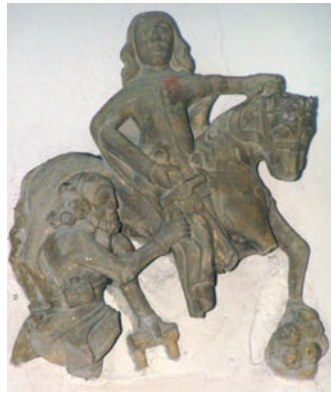
(2) Mantelteilung (13. Jh.)

Wir freuen uns, dass Ihr Weg Sie in die Stadtkirche St. Martin in Tauberbischofsheim geführt hat. Sie ist Mittelpunkt der katholischen Gemeinde, deren Ursprünge wohl in das 7. Jahrhundert zurückreichen. St. Martin ist ein Ort, der Kontinuität ausstrahlt. Von der romanischen Kirche des 13. Jahrhunderts ist der