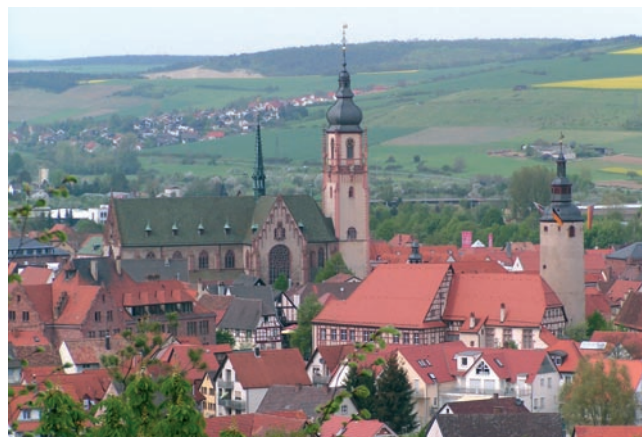
St. Martin und das Schloss

Sobald man den 51 m langen, 24 m breiten und 17 m hohen KIRCHENRAUM betreten hat, wird der Blick vom Hochaltar angezogen. Die weiten Gänge in Mittel-