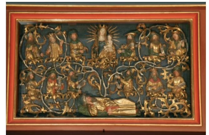
(7) Marienaltar – Predella-Relief (1517, v. Niklaus Weckmann)

Als eines der großen Kunstwerke des Spätmittelalters ist der MARIENALTAR (7) in der linken Seitenapsis mit seinem rein marianischen Bildprogramm zu bezeichnen. Es handelt sich um eine Arbeit wahrscheinlich